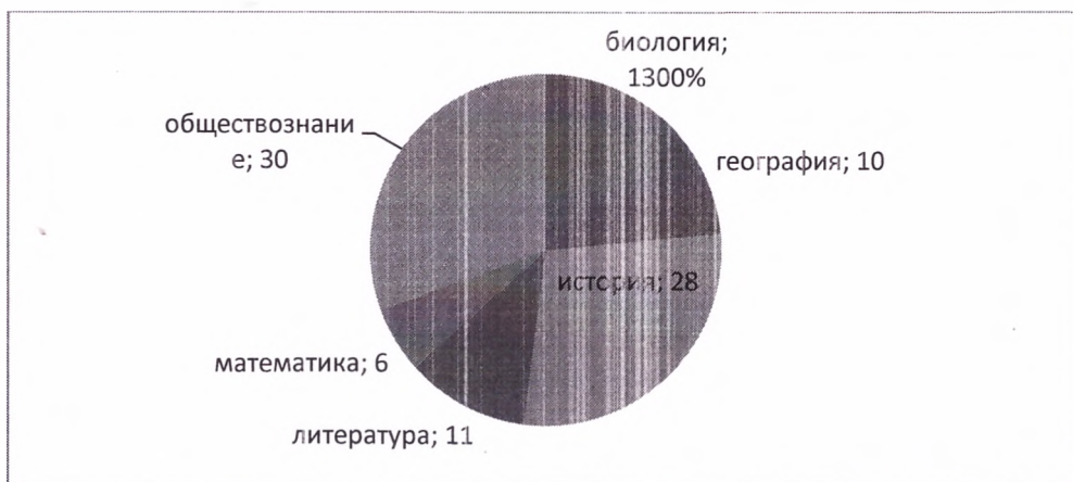
Диаграмма победителей школьного этапа ВсОШ

В 2022 году был проанализирован объем участников конкурсных мероприятий разных уровней. Дистанционные формы работы с учащимися, создание условий для проявления их познавательной активности позволили принимать активное участие в дистанционных конкурсах регионального, всероссийского и международного уровней. Результат – положительная динамика участия в олимпиадах и конкурсах, привлечение к участию в интеллектуальных соревнованиях большего количества обучающихся Школы.